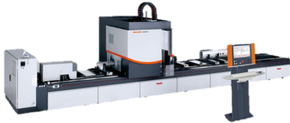
Max. Profilstababmessung Länge 8000mm Breite 300mm Höhe 250mm